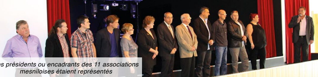
Les présidents ou encadrants des 11 associations mesniloises étaient représentés