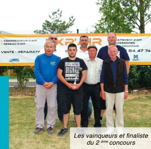
Les vainqueurs et finaliste du 2 ème concours