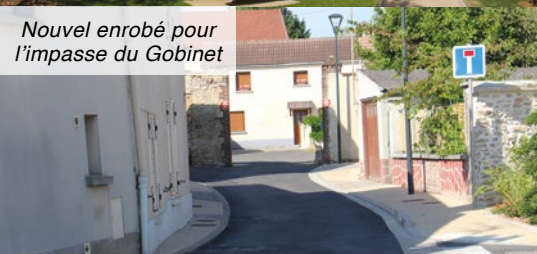
Nouvel enrobé pour l'impasse du Gobinet