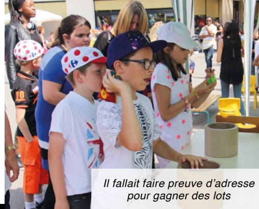
Il fallait faire preuve d'adresse pour gagner des lots