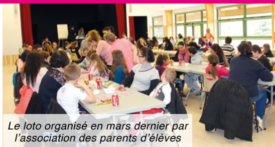
Le loto organisé en mars dernier par l'association des parents d'élèves

Leur principale tâche consiste à récolter des fonds et des lots pour améliorer les événements qui tournent autour de la vie de l'école. La subvention qu'elles obtiennent de la mairie ainsi que l'argent récolté lors de lotos ou ventes de gâteaux leur permet de financer la kermesse de fin d'année et ses lots, les médailles distribuées aux enfants, gérer les goûter après la balle ovale à Othis... L'équipe de l'amicale des parents d'élèves remercie tous les bénévoles (parents et anciens parents d'élèves,