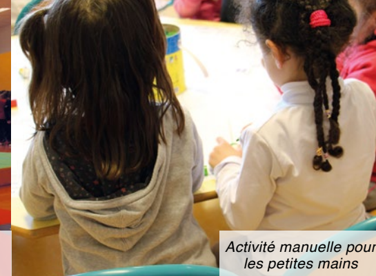
Activité manuelle pour les petites mains