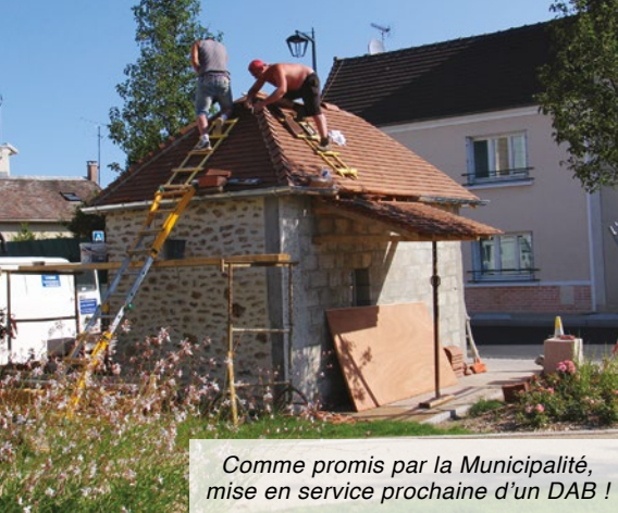
Comme promis par la Municipalité, mise en service prochaine d'un DAB !