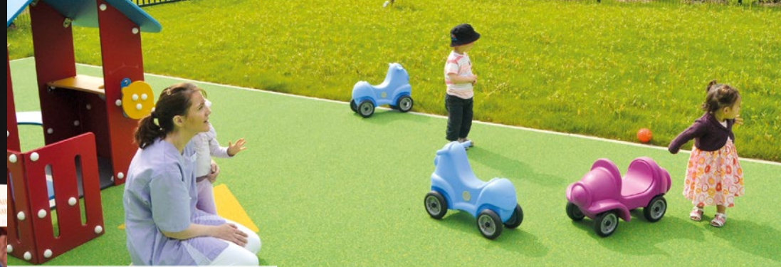
Le coût de fonctionnement des crèches (ici la mini-crèche d'Othis)...