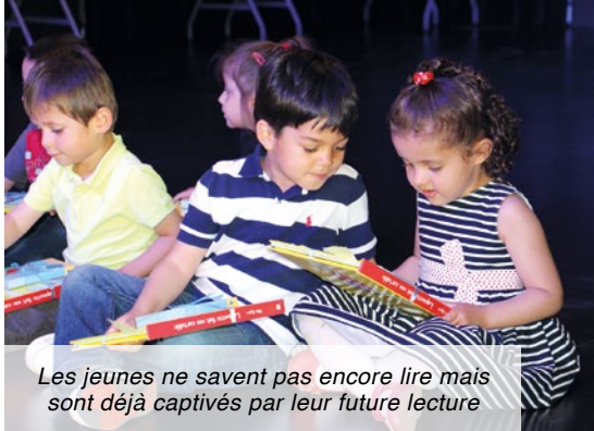
Les jeunes ne savent pas encore lire mais sont déjà captivés par leur future lecture