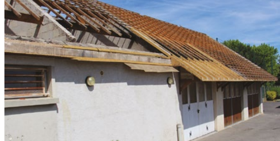
La salle Rousseau a été démolie pour laisser place au futur vestiaire foot et à une nouvelle salle.

La rue A. Parreux (entre la rue de Claye et la route périphérique de l'aéroport/ RN 1104) est en phase d'élargissement puisqu'elle va prochainement faire peau