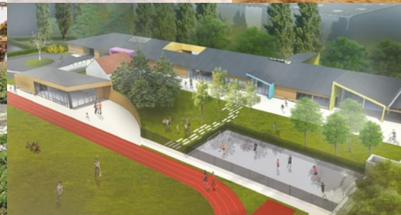
Le chantier comporte un CLSH, une MAM, une salle et un vestiaire de foot.