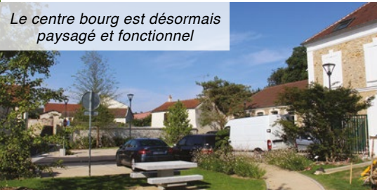
Le centre bourg est désormais paysagé et fonctionnel

Le petit local abritant le distributeur automatique à billets (DAB) est quasi fini et sera très bientôt en service. Grâce à sa jolie toiture de petites tuiles et à ses pierres de parement, il s'intègre parfaitement dans le centre bourg, devant l'ancien accueil de loisirs, rue de Claye.