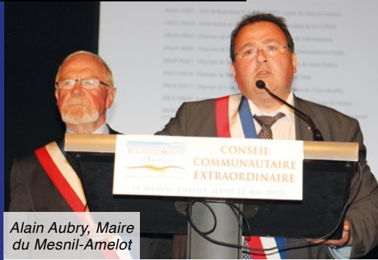
Alain Aubry, Maire de Mesnil-Amelot