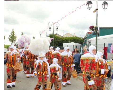
Les Gilles de Charleroi ont fait forte impression devant les nombreux visiteurs

La journée s'est poursuivie dans la joie et la bonne humeur avec la visite des Gilles de Charleroi qui distribuèrent des oranges aux nombreux visiteurs. Alors que la fête foraine battait son plein, que les cris de joie des enfants envahissaient les rues, les poneys des écuries de la Garenne de Moussy le Neuf, faisaient battre le coeur de jeunes cavaliers en herbe lors de petites balades dans les chemins de la commune. Le lendemain, la fête perdurait encore un peu grâce aux mille tickets de manèges distribués par la Municipalité à tous les enfants de l'école.