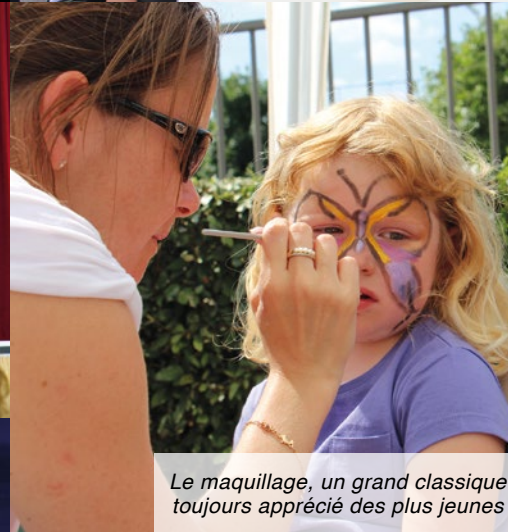
Le maquillage, un grand classique toujours apprécié des plus jeunes