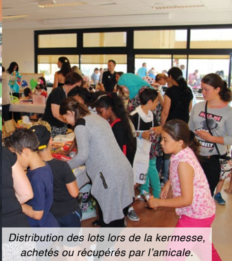
Distribution des lots lors de la kermesse, achetés ou récupérés par l'amicale.