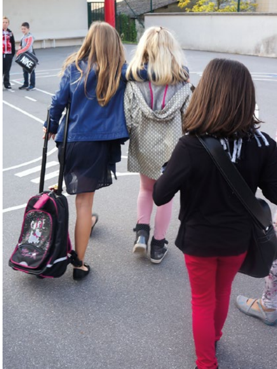
Les cartables sont bouclés. C'est reparti pour une année scolaire !

Les TAP ne sont pas obligatoires, ils sont proposés gratuitement sauf pour l'étude.