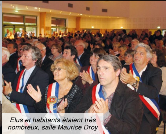
Elus et habitants étaient très nombreux, salle Maurice Droy