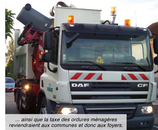
... ainsi que la taxe des ordures ménagères reviendraient aux communes et donc aux foyers.