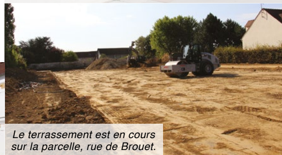
Le terrassement est en cours sur la parcelle, rue de Brouet.