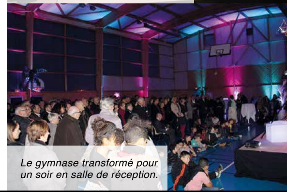
Le gymnase transformé pour un soir en salle de réception.