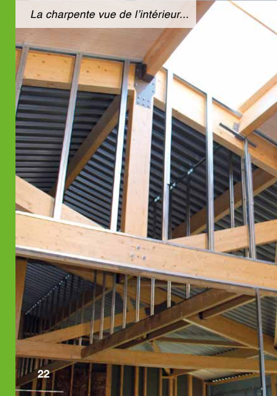
La charpente vue de l'intérieur...

prévu. L'élévation des murs, côté «maison des assistantes maternelles», est sur le point d'être terminée, sa couverture est en cours. Concernant le bâtiment du fond, les ouvriers posent actuellement les châssis vitrés ainsi que les cloisons intérieures.