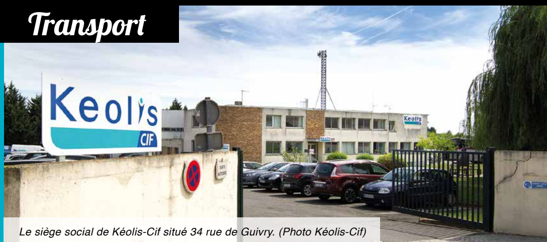
Le siège social de Kéolis-Cif situé 34 rue de Guivry.

Situé au Mesnil-Amelot (34 rue de Guivry), le siège social est relayé par des unités d'exploitation localisées au cœur des territoires autour de la plate-forme aéroportuaire :