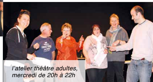
l'atelier théâtre adultes, mercredi de 20h à 22h