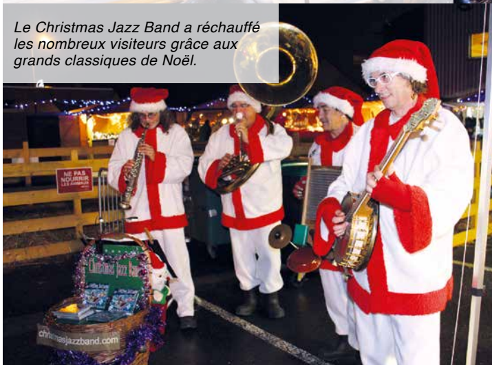
Le Christmas Jazz Band a réchauffé les nombreux visiteurs grâce aux grands classiques de Noël.

Il y en avait pour tous les goûts : 20 chalets cerclaient le parking du gymnase et proposaient de nombreuses idées cadeaux, des produits du terroir à déguster, les pains et brioches de notre boulanger ou autres petites friandises comme les fabuleuses barbes à papa aux goûts improbables.