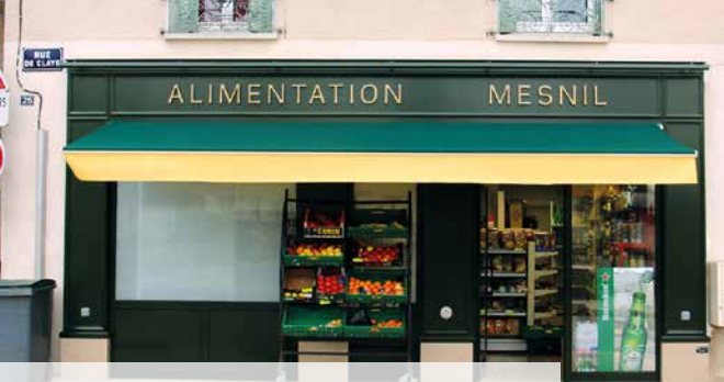
La devanture de l'épicerie «Alimentation Mesnil» est maintenant aux normes P.M.R.