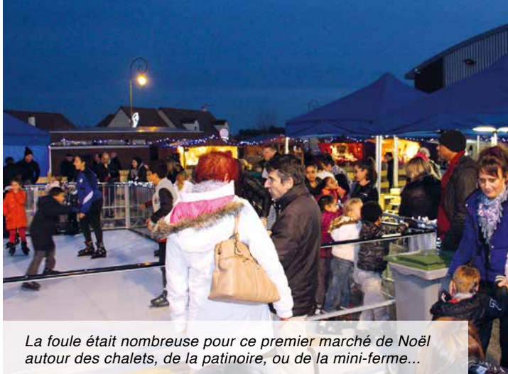
La foule était nombreuse pour ce premier marché de Noël autour des chalets, de la patinoire, ou de la mini-ferme...

Les 18 et 19 décembre derniers, c'était une première pour la Municipalité et le Comité des fêtes, mais qu'ils soient badauds, exposants, ou organisateurs, tous sont unanimes. Ce fut un très