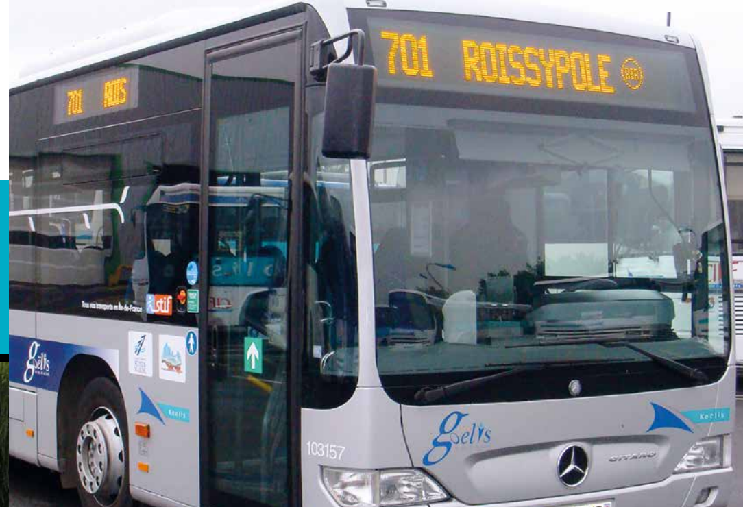
Les lignes régulières 701 et 702 desservent le Mesnil-Amelot.