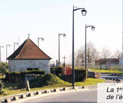
La 1 ère phase du remplacement de l'éclairage est terminée.