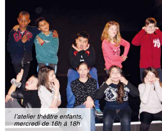
l'atelier théâtre enfants, mercredi de 16h à 18h

Les portes de la salle Maurice Droy sont toujours ouvertes aux heures de répétition (mercredi après-midi) pour les personnes qui souhaiteraient découvrir ces ateliers. Pour tout renseignement, contactez Lionel Emery au 06 60 45 20 14.