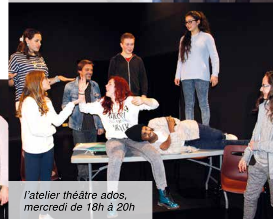
l'atelier théâtre ados, mercredi de 18h à 20h