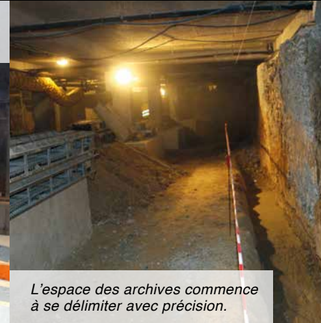
L'espace des archives commence à se délimiter avec précision.