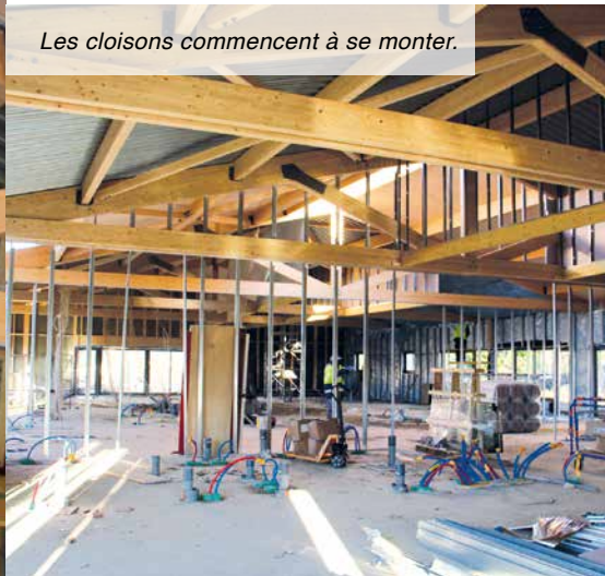
Les cloisons commencent à se monter.

prévu. L'élévation des murs, côté «maison des assistantes maternelles», est sur le point d'être terminée, sa couverture est en cours. Concernant le bâtiment du fond, les ouvriers posent actuellement les châssis vitrés ainsi que les cloisons intérieures.