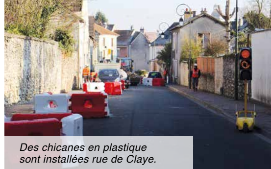
Des chicanes en plastique sont installées rue de Claye.