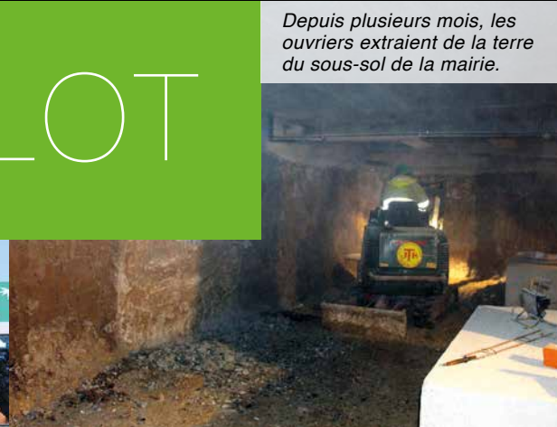
Depuis plusieurs mois, les ouvriers extraient de la terre du sous-sol de la mairie.