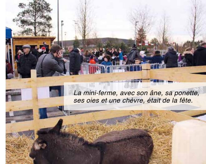
La mini-ferme, avec son âne, sa ponette, ses oies et une chèvre, était de la fête.

La Municipalité et le Comité des fêtes vous donnent d'ores et déjà rendez-vous l'an prochain pour retrouver cette familiale et chaleureuse ambiance.