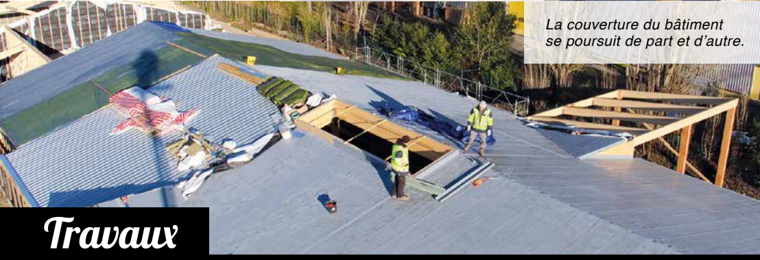
La couverture du bâtiment se poursuit de part et d'autre.