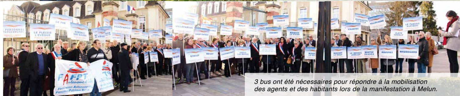
3 bus ont été nécessaires pour répondre à la mobilisation des agents et des habitants lors de la manifestation à Melun.

Depuis le dernier « Mesnilois », n° 6 (septembre, octobre, novembre) nos élus n'ont cessé de se battre pour sauver leur (et votre) territoire, la communauté de communes Plaines et Monts de France.