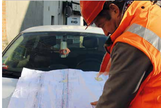
A terme, ce sont 18 stationnements qui seront créés.