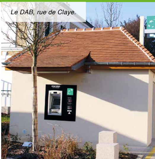
Le DAB, rue de Claye.

La Municipalité se battait bec et ongle depuis de longues années pour obtenir un distributeur automatique de billets. Dossier sensible puisque les banques rechignent souvent à installer un tel équipement jugé non rentable. Aujourd'hui, c'est chose faite puisqu'il est en service depuis fin décembre. Alors plus d'excuse : si vous n'avez plus d'espèces dans votre porte-monnaie, notamment le soir et le dimanche, rendez-vous rue de Claye, à côté de la boulangerie.