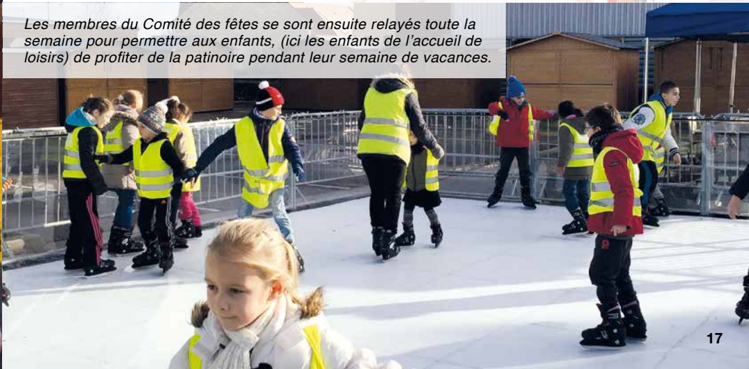
Les membres du Comité des fêtes se sont ensuite relayés toute la semaine pour permettre aux enfants, (ici les enfants de l'accueil de loisirs) de profiter de la patinoire pendant leur semaine de vacances.