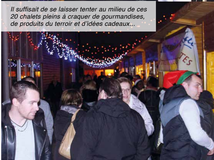
Il suffisait de se laisser tenter au milieu de ces 20 chalets pleins à craquer de gourmandises, de produits du terroir et d'idées cadeaux...

Haribo, l'âne, Danette, la ponette du centre équestre de Choisy, une biquette et 2 oies nous avaient rendu visite pour l'occasion et amuser les enfants.