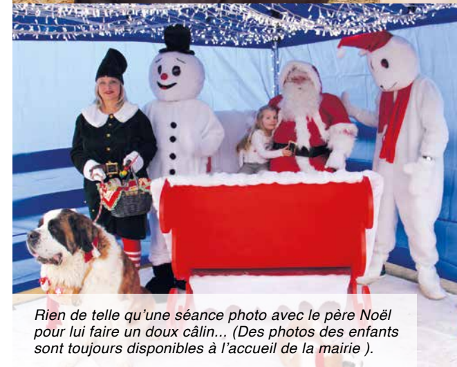
Rien de tel qu'une séance photo avec le père Noël pour lui faire un doux câlin... (Des photos des enfants sont toujours disponibles à l'accueil de la mairie).