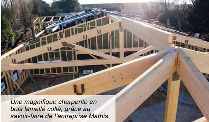
Une magnifique charpente en bois lamellé collé, grâce au savoir-faire de l'entreprise Mathis.

Le chantier du Centre d'Accueil de Loisirs sans Hébergement se poursuit, pour le moment, comme