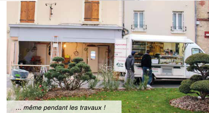
... même pendant les travaux !