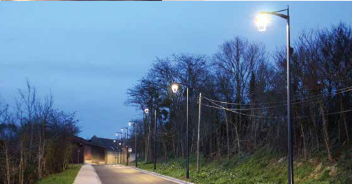
La rue A. Parreux, équipée d'éclairage public.

La rue A. Parreux est également éclairée. Les travaux sont quasi terminés. L'opérateur Orange doit simplement enfouir ses réseaux.