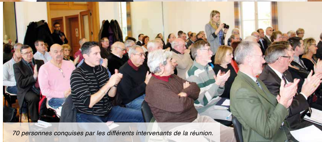
70 personnes conquises par les différents intervenants de la réunion.