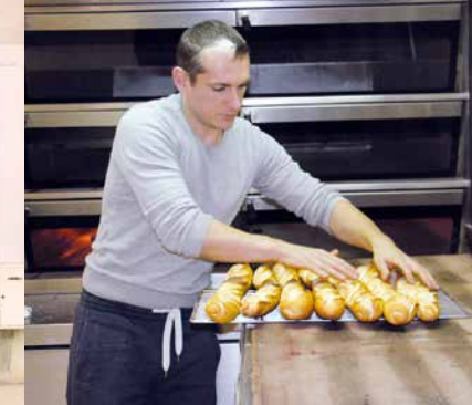
Du bon pain tout chaud...