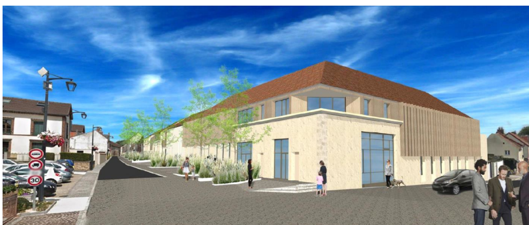
Figure 3: Plan masse et vue du projet de centre de santé. La perspective permet également de voir l'élargissement de la rue de Guivry- source: dossier évaluation environnementale, p. 22 et 24.

Pour justifier la localisation du projet retenue, le dossier met en avant « la présence d'un parking aux abords (18 places) » (p. 23). Or la MRAe observe que néanmoins le projet ne semble pas s'en satisfaire car la plupart des espaces publics créés – à la périphérie et en cœur d'îlot – sont consacrés à de nouveaux stationnements, sans en donner le nombre, ni présenter la stratégie de mobilité qui les justifie.