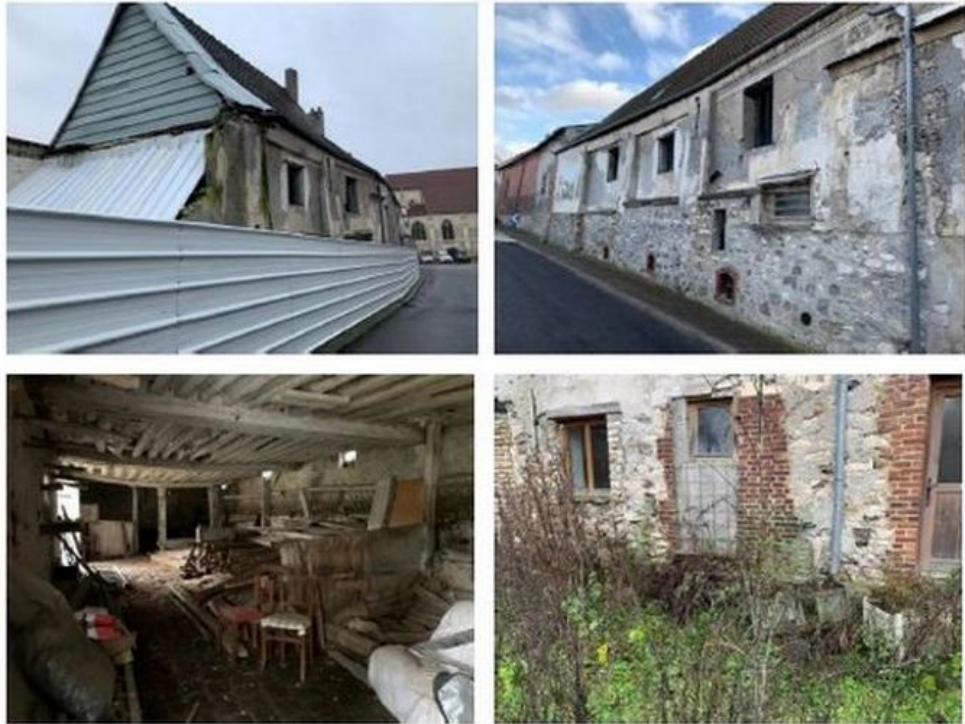
Figure 2: Photographies du corps de ferme existant

La MRAe note que le projet de construction d'une maison de santé en lieu et place du bâtiment remarquable à protéger n° 2 consiste à conserver le volume du corps de ferme actuel et les éléments architecturaux remarquables non dégradés : l'ensemble de l'emprise du corps de ferme, la cour centrale et l'agencement des bâtiments en U sont conservés 6 . Par ailleurs, des modifications sont apportées à l'article 11 du règlement de la zone UF, par l'introduction de dispositions spécifiques pour les parcelles cadastrées section AL n° 192, 232, 44 et 236 afin d'encadrer l'aspect extérieur des constructions sur le terrain d'assiette du corps de ferme. Selon le dossier, « ces dispositions feront l'objet d'une modification simplifiée, qui sera délibérée ultérieurement par le conseil municipal » (p. 9), sans toutefois que ce report ne soit précisément justifié.